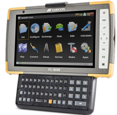
FC6000 (TECLADO OPCIONAL)